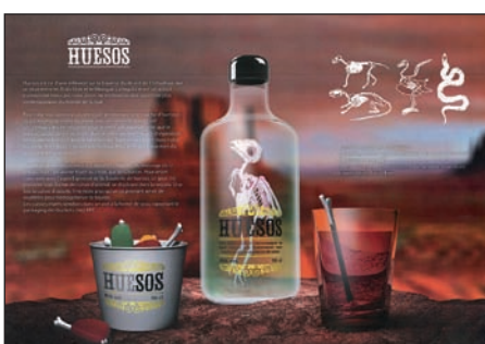
COUP DE COEUR : « Huesos » par Jordan Beline, Malou de Kerdanet et Baptiste Placier